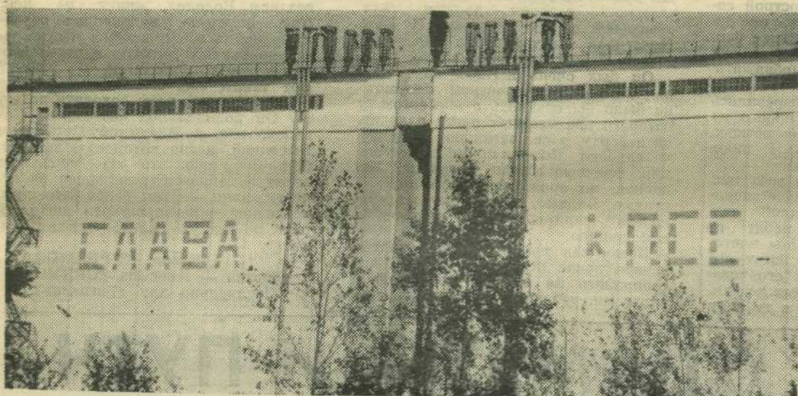
БИРОБИДЖАН. 19 августа 1991 года. База хлебопродуктов.